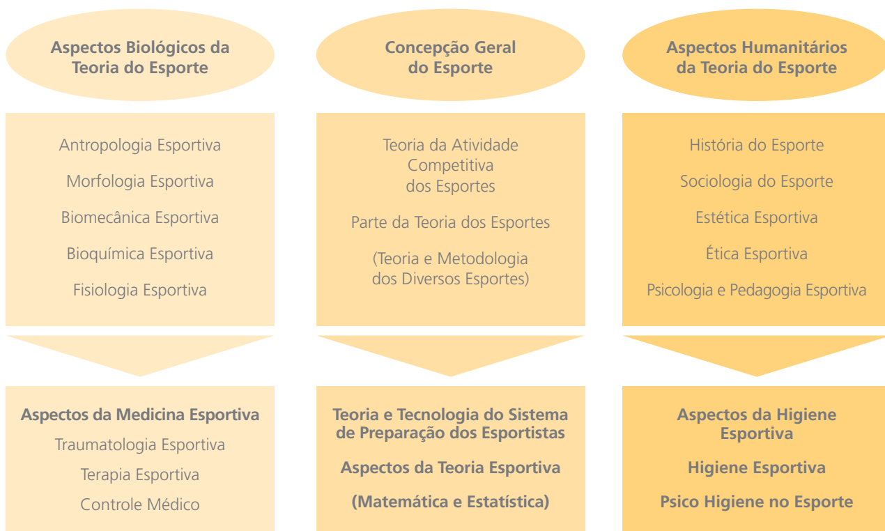
Figura 2 – Aspectos influenciadores na formação da teoria do esporte.

As diversas áreas da atividade humana com seus conhecimentos sistematizados em uma teoria podem explicar algumas manifestações que ocorrem na prática dos esportes de alto rendimento. Isso fica mais claro quando passamos a compreender o esporte não só como se vê, mas sim como ele pode ser preparado e conseqüentemente evidenciado como um verdadeiro espetáculo. As figuras 1 e 2 apresentam uma relação direta entre as diversas áreas e suas relações com a prática esportiva de alto rendimento 15,16 .